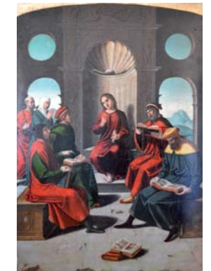
Disputa con los doctores