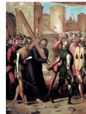
Camino del Calvario