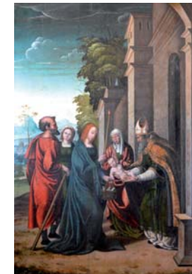
Presentación en el Templo