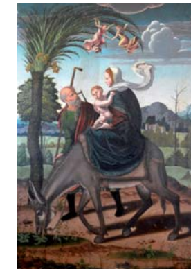
Huida a Egipto