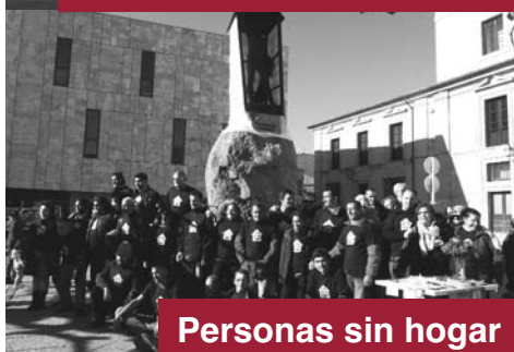
Personas sin hogar