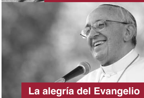
La alegría del Evangelio