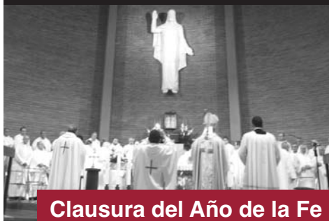
Clausura del Año de la Fe