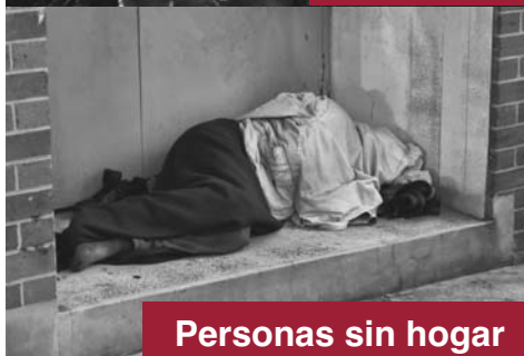
Personas sin hogar