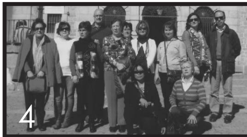
1. Retiro de Cuaresma de CONFER (14-3) 2. 24 Horas para el Señor y Vía Matris (13/14-3) 3. Encuentro de ministros extraordinarios de la Comunión (14-3) 4. Ejercicios espirituales para catequistas en Ávila (6/8-3)