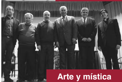
Arte y mística