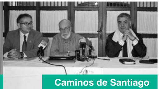
Caminos de Santiago