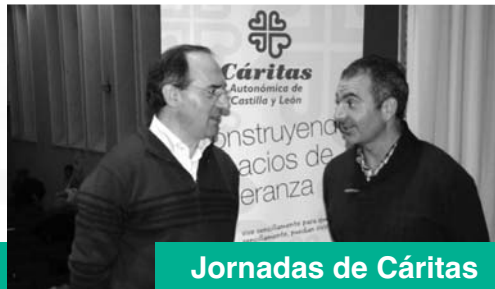
Jornadas de Cáritas