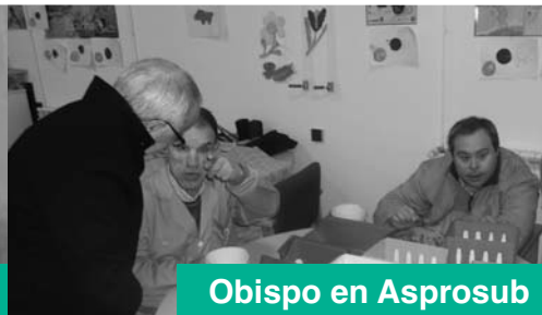
Obispo en Asprosub