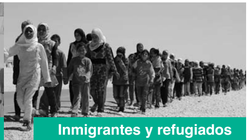
Inmigrantes y refugiados