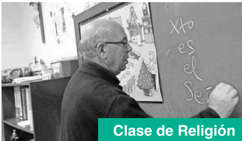
Clase de Religión