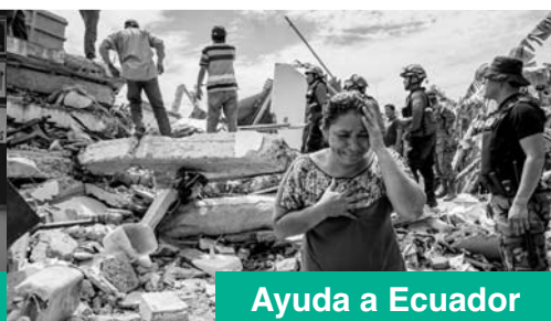
Ayuda a Ecuador