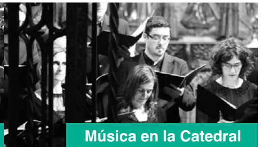
Música en la Catedral