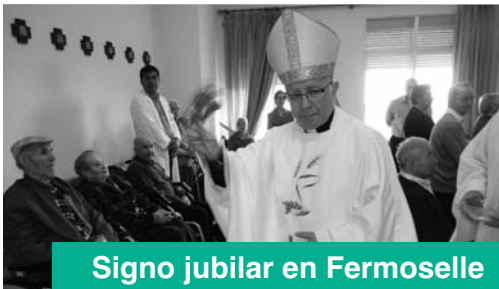
Signo jubilar en Famoselle