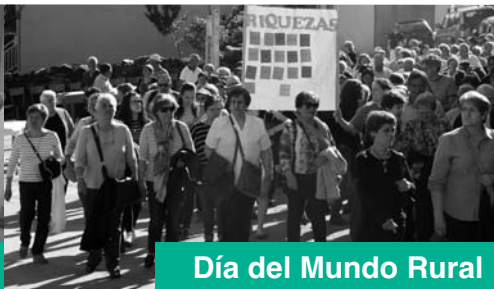
Día del Mundo Rural