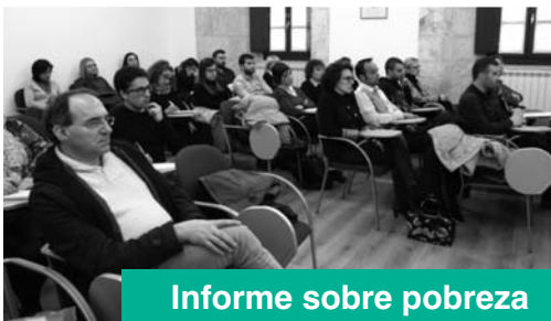
Informe sobre pobreza